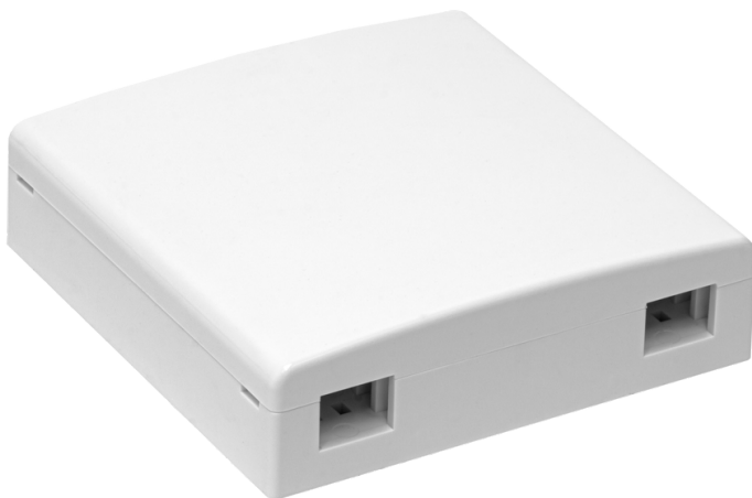
Рисунок 1 - Общий вид