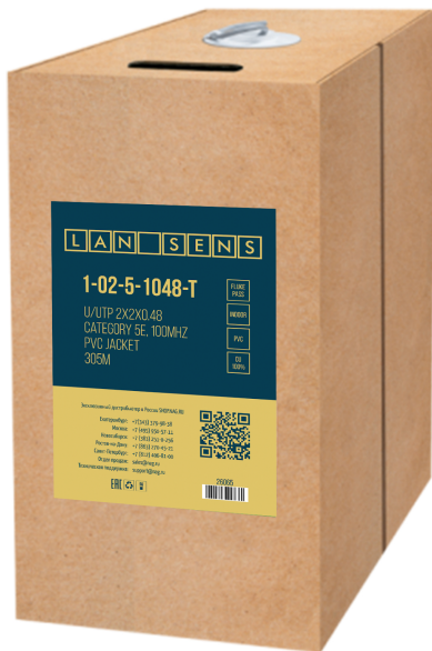
Рисунок 1 - Упаковка